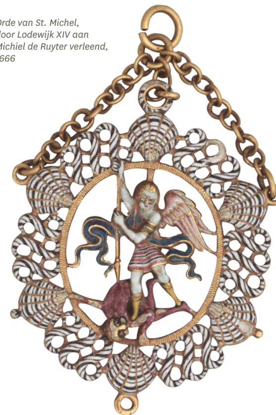
Orde van St. Michel, door Lodewijk XIV aan Michiel de Ruyter verleend, 1666

aandachtspunten aangegeven die voor de actualisering van het Handboek aangepakt moeten worden. Belangrijk daarbij is dat het Handboek uitgebreid wordt met procedures die betrekking hebben op het behoud en beheer van collecties in het tentoonstellingsgebouw.