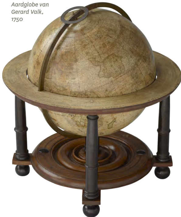
Aardglobe van Gerard Valk, 1750

van het samenwerkingsproject 'Maritiem Digitaal' een sprekend voorbeeld is. De toepassing van de Nationale Strategie in combinatie met de mogelijkheden van nieuwe digitale tools zijn bepalend voor de invulling van dit project en de ontwikkeling van Het Maritiem Portal.