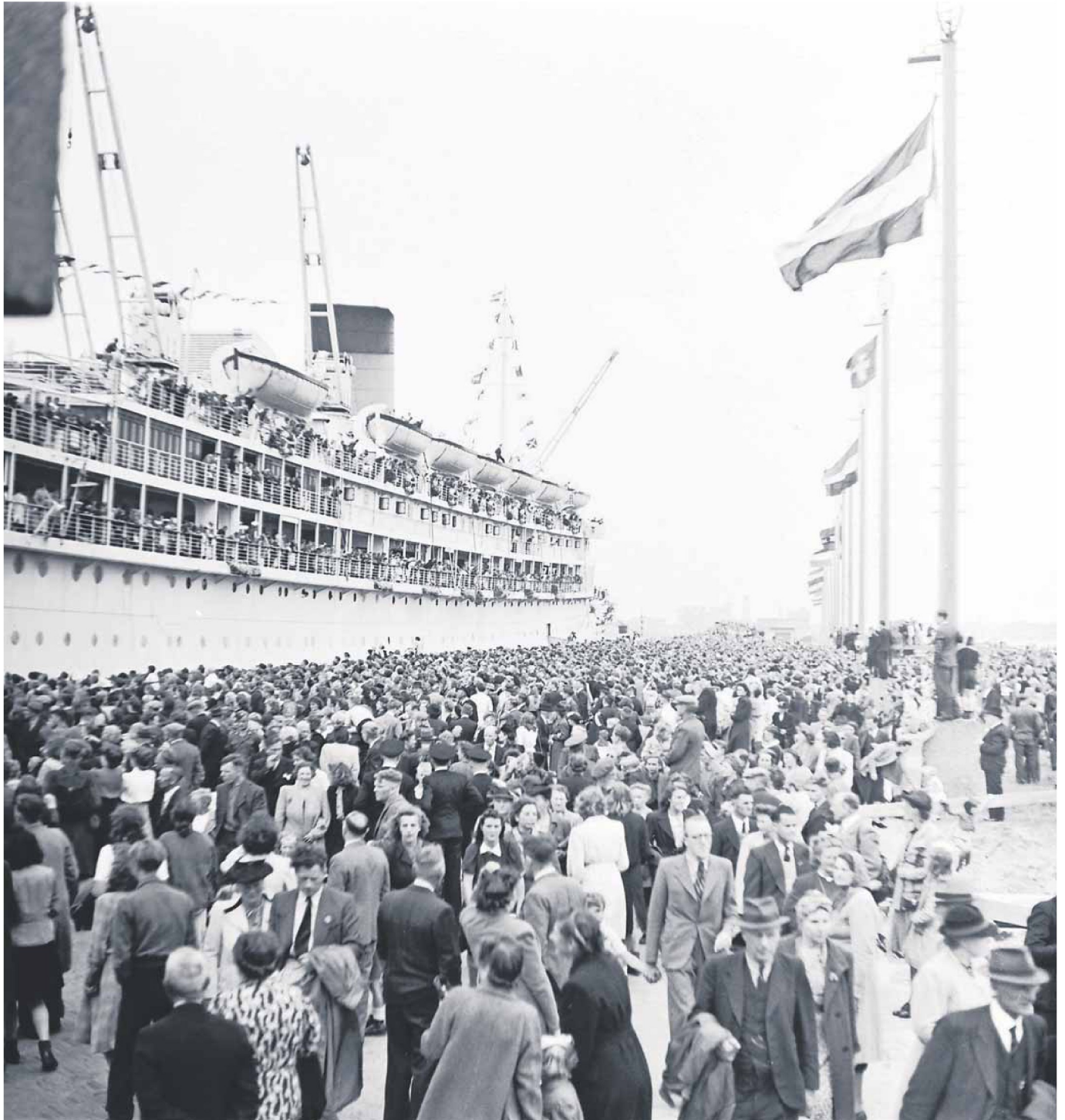
De Oranje voer in 1946 weer voor het eerst op het IJ en werd feestelijk onthaald door enthousiaste Amsterdammers.