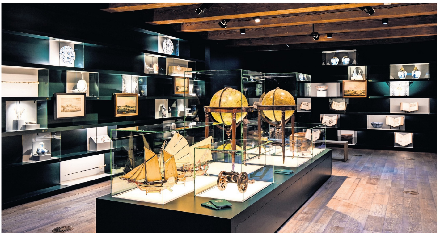
Een van de vernieuwde zalen in Het Scheepvaartmuseum.