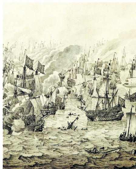
→ De zeeslag bij Nieuwpoort, 1653, door Willem van de Velde de Oude.