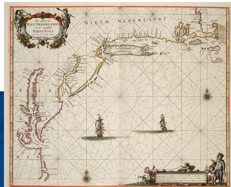
▲ zeekaart van een gedeelte van de oostkust van de Verenigde Staten tussen Kaap Cod en Kaap Hatteras, s.1034(17) [kaart 035].