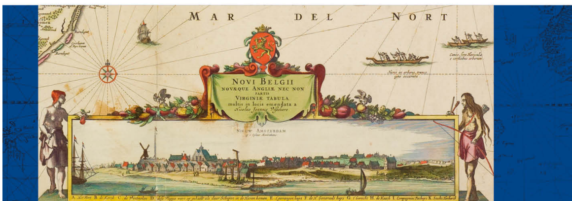
▲ uitsnede van een met de hand gekleurde kaart van Nieuw Nederland, Nieuw Engeland en een deel van Virginia. Zichtbaar is het aanzicht van de stad Nieuw Amsterdam, a.0145(064)5.