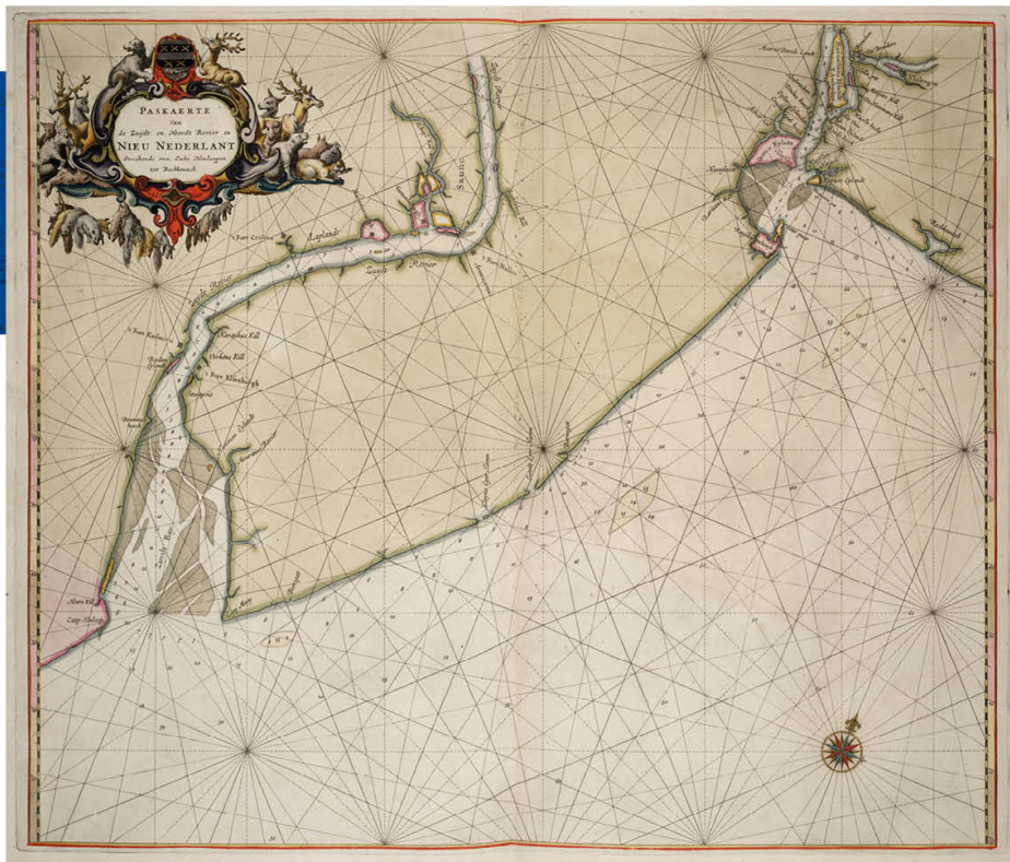
▲ zeekaart van de oostkust van de Verenigde Staten tussen de mondingen van de rivieren de Hudson en Delaware, s.1034(17) [kaart 036].

drie jaar oud: de Halve Maen . Opvallend is dat er slechts één schip uitvoer voor deze verkenning, meestal gingen er toch wel meerdere schepen mee.