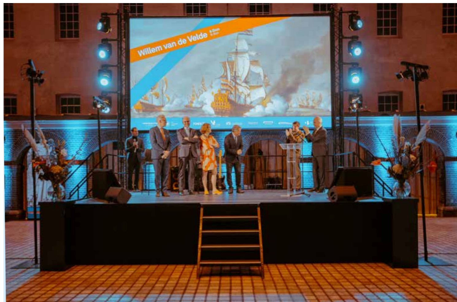
Opening Willem van de Velde & Zoon, september 2021

met de Nederlandse controlestandaarden, ethische voorschriften en de onafhankelijkheidseisen.