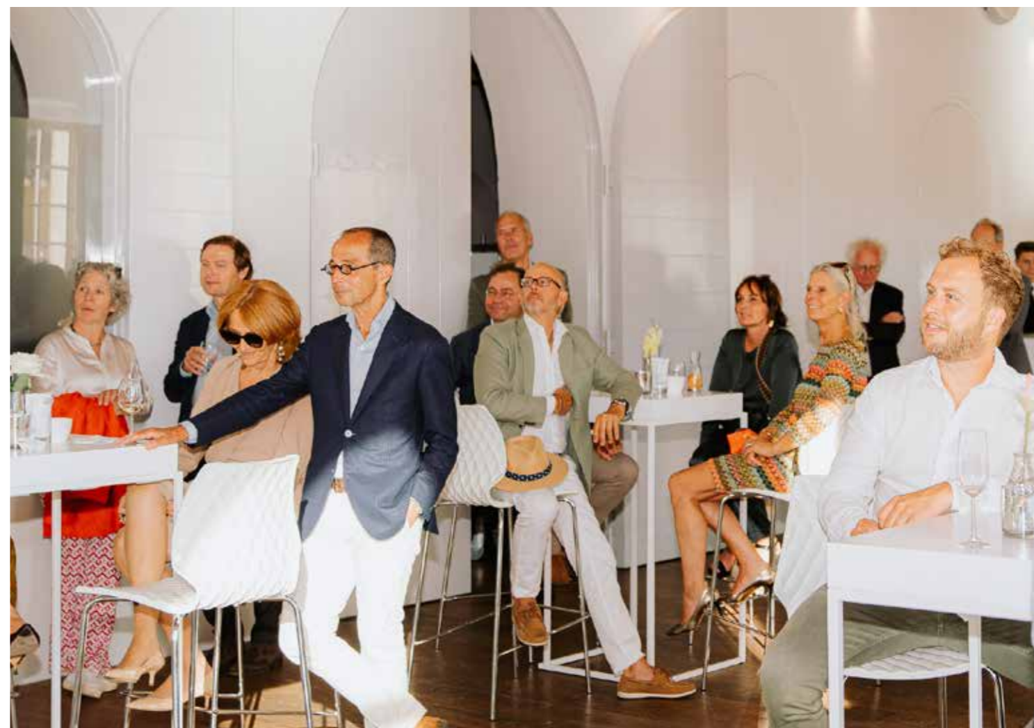
Zomerborrel, juli 2021