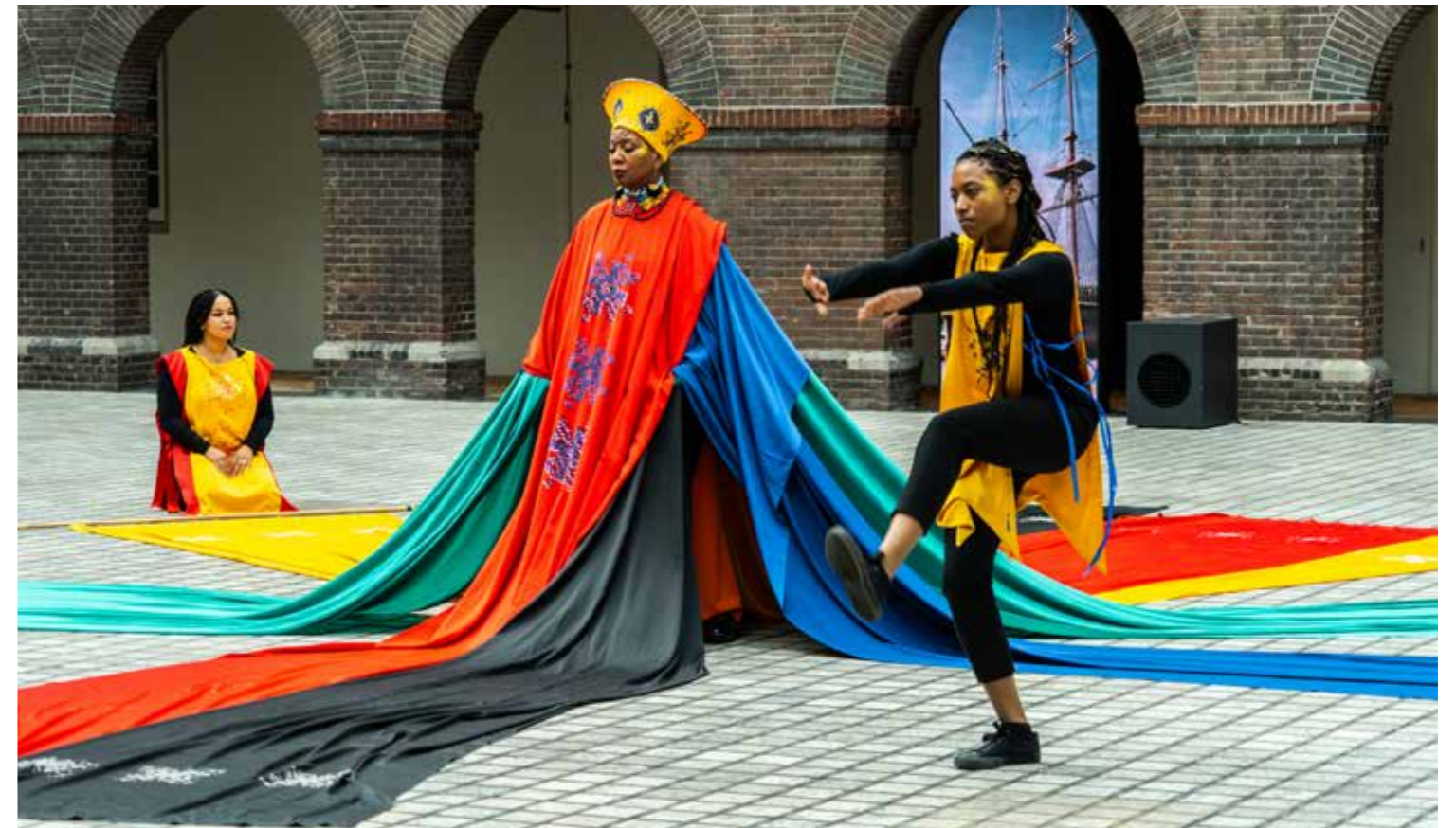
Voorstelling Future for the Past

combinatie met voldoende weerstandsvermogen staat het museum er goed voor.