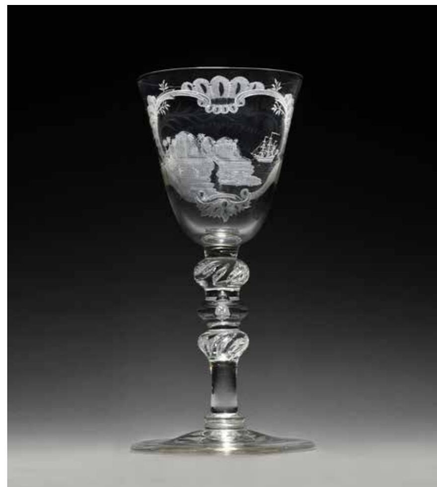
glas plantage Molshoop, Suriname, 18 e eeuw

In 2021 zijn door meerdere aankopen en schenkingen 80 museale voorwerpen aan de verzameling en 290 publicaties aan de bibliotheek toegevoegd. Bepalend bij de keuze tot verwerving zijn daarbij de vijf collectiethema's (Nederlanders en de wereld; Nederland als maritieme natie; De zee als bron van inspiratie; De zee als