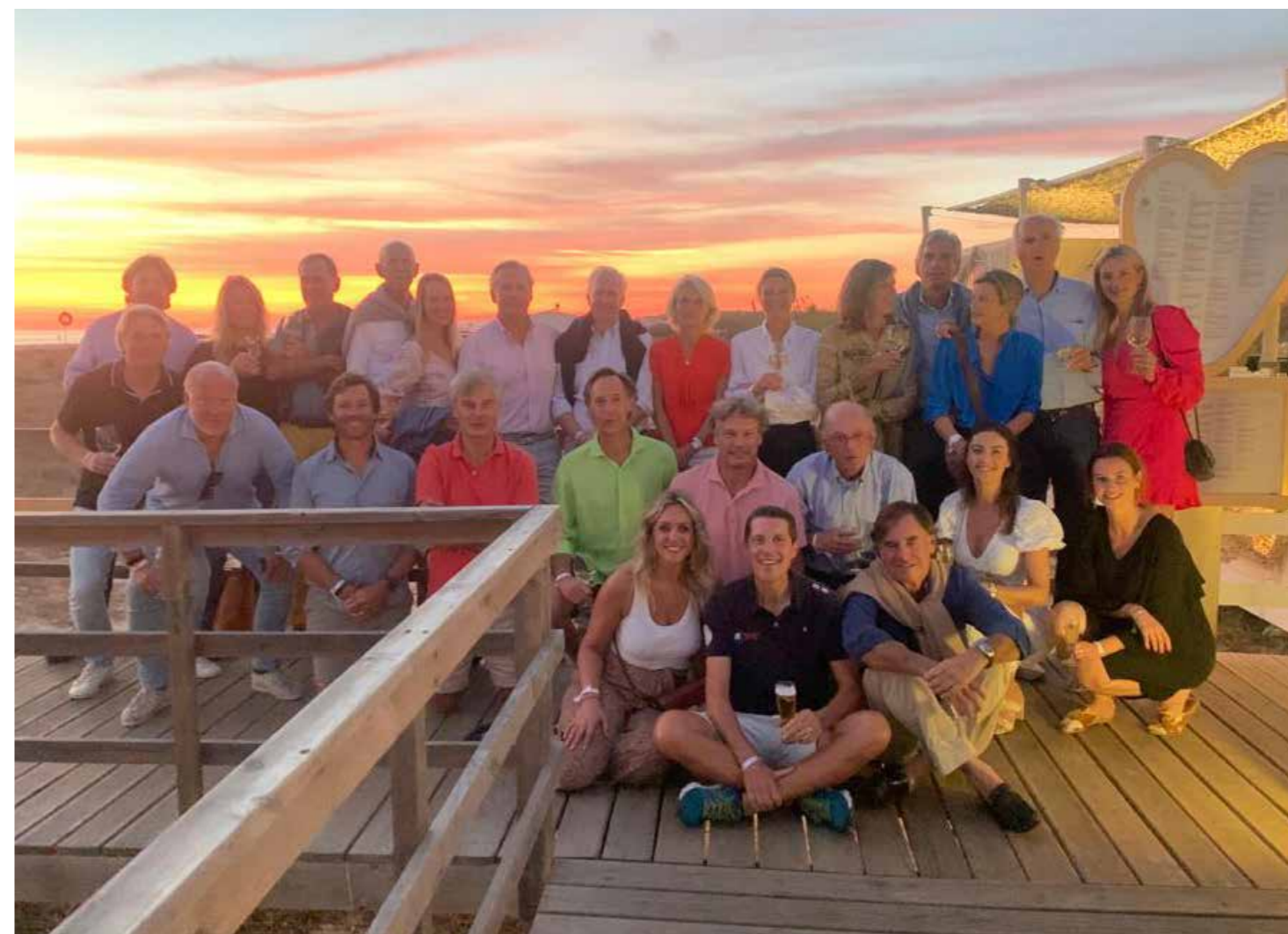
Heeren XVII Cup Vilamoura, oktober 2022