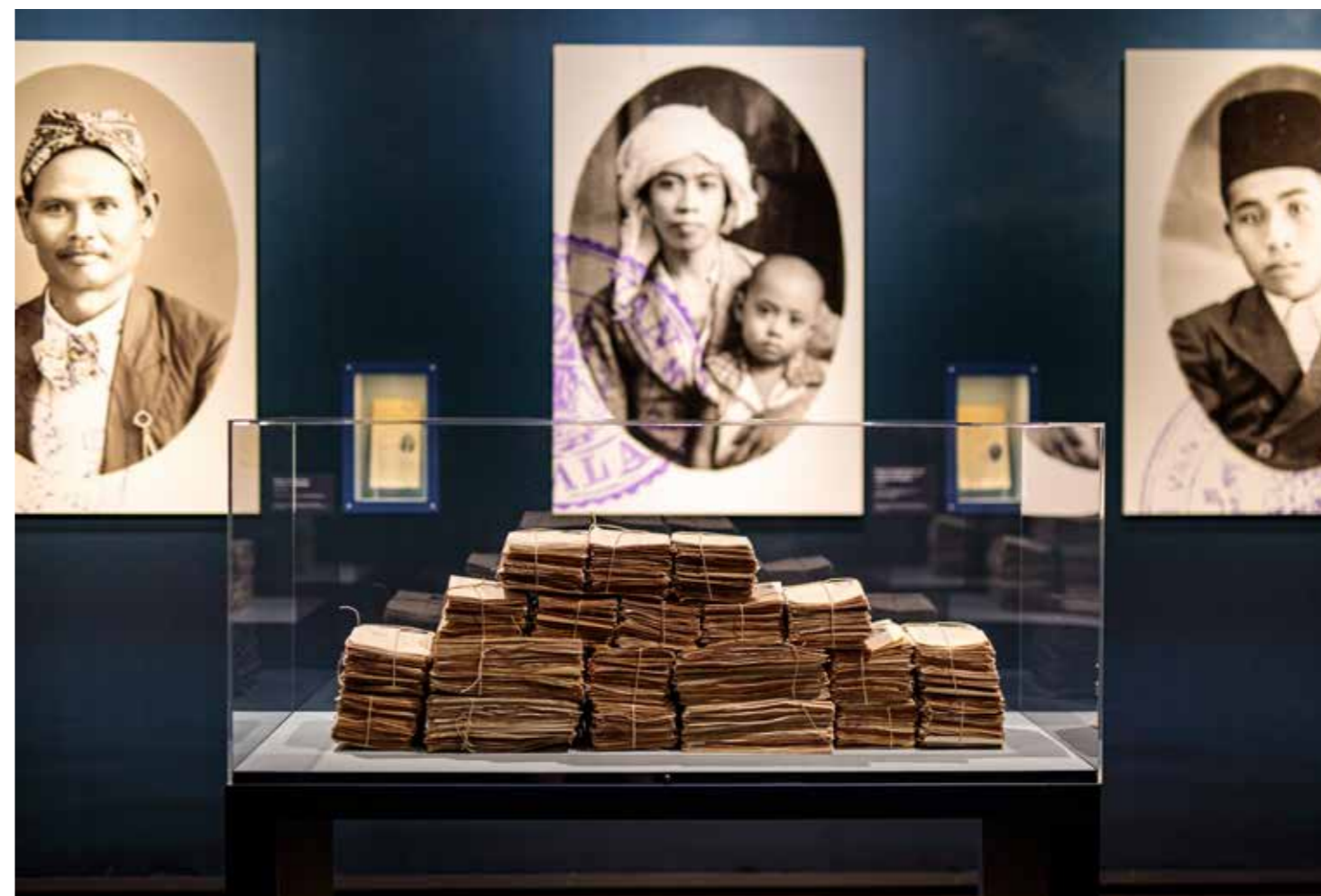
Tentoonstelling Mens op Zee