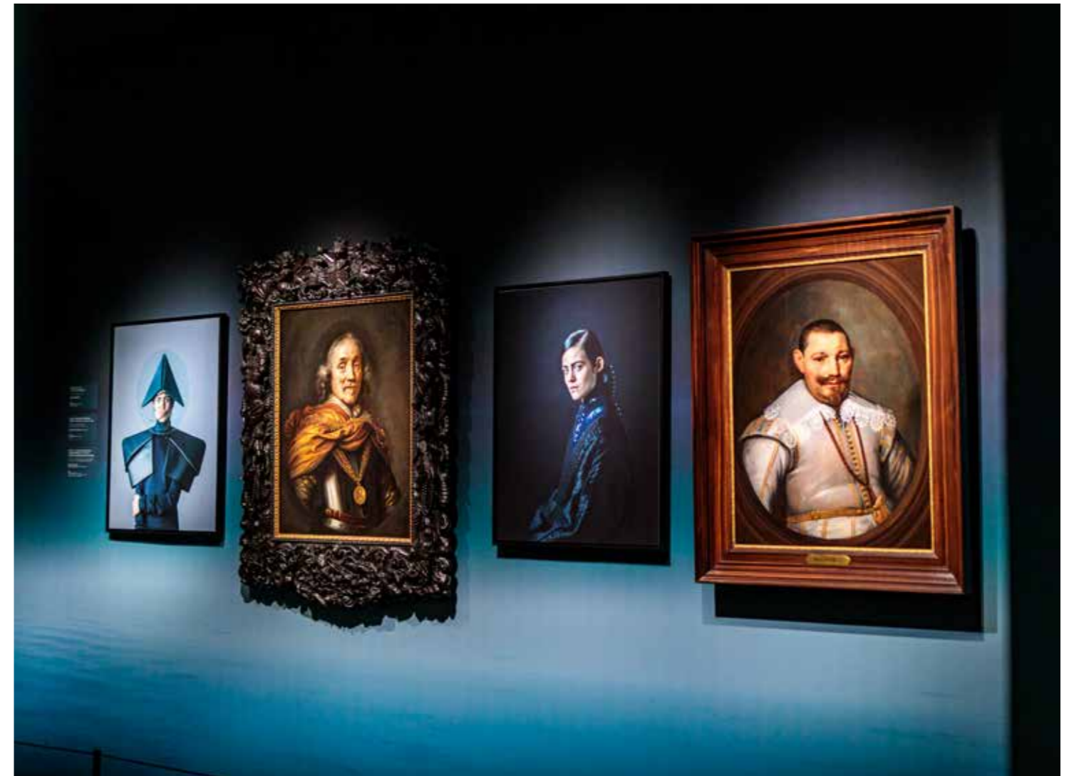
Tentoonstelling 'Mens op Zee'

Het Compagnie Fonds is geen financieringsverplichting aangegaan. De solvabiliteit en liquiditeit bedroegen per 31 december 2022 respectievelijk 96,5% en 28,2. Het fonds heeft op 31 december 2022 een eigen vermogen van € 973.014.