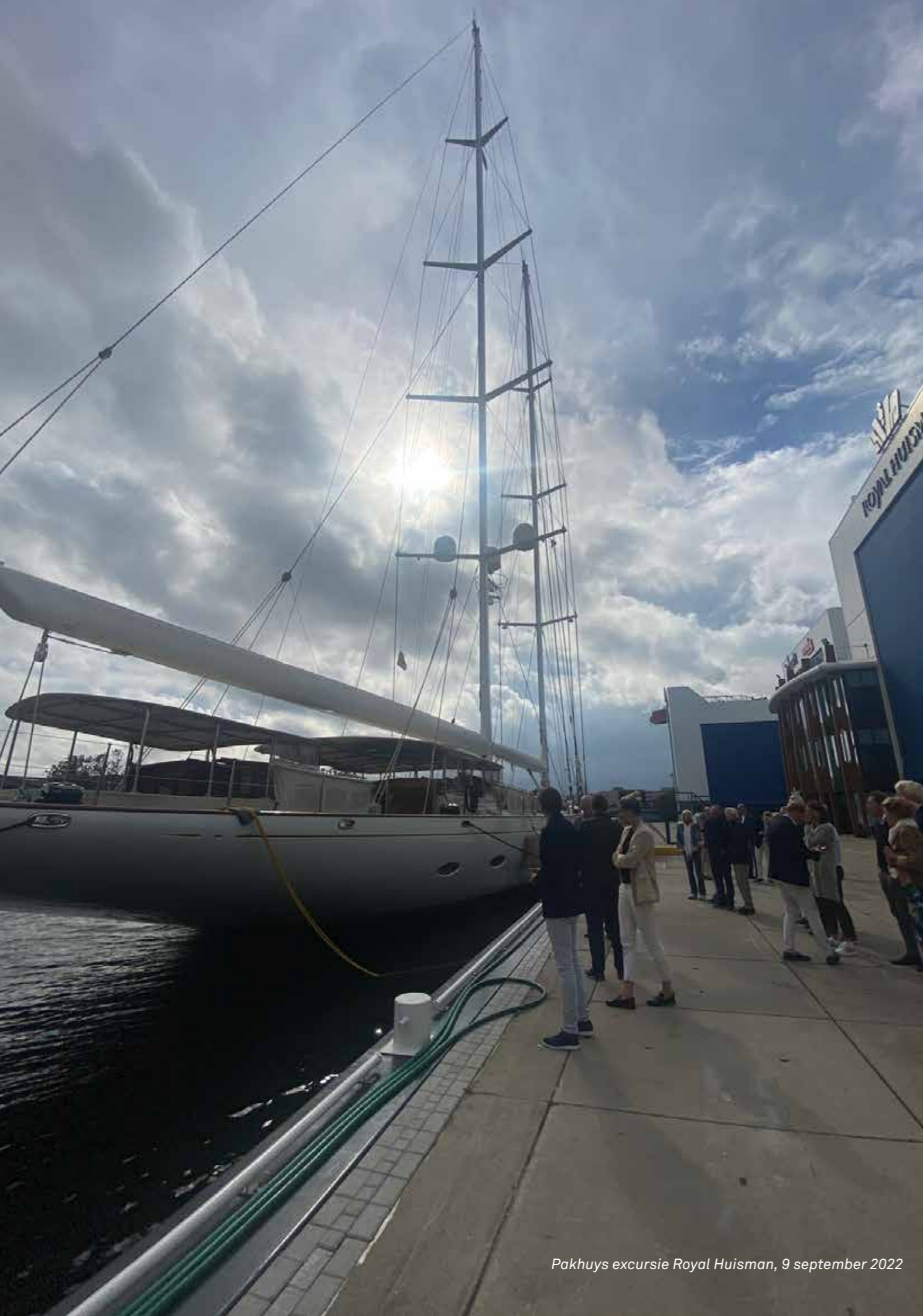
Pakhuys excursie Royal Huisman, 9 september 2022