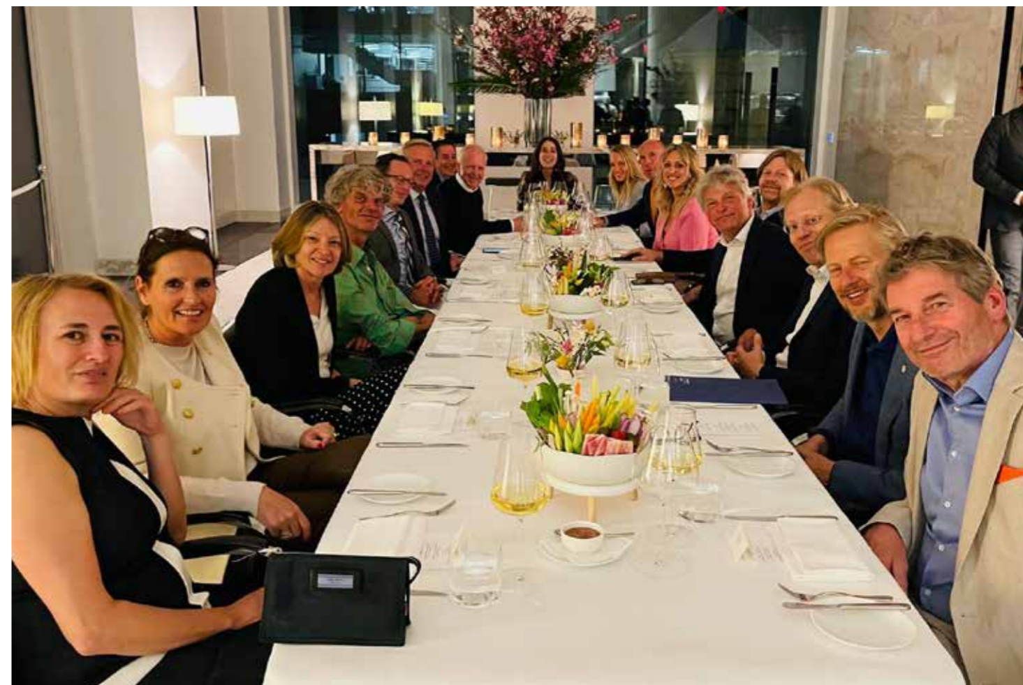
Diner New York, 27 april 2022