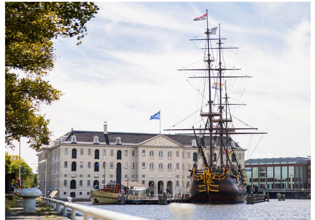
Het Scheepvaartmuseum en VOC-schip - Twycer

De VNHSM heeft de status van "Culturele ANBI". Giften aan goede doelen organisaties zijn aftrekbaar van het belastbaar inkomen als de instelling is aangemerkt als een Algemeen Nut Beogende Instelling (ANBI). Voor een Culturele ANBI geldt vooralsnog in het algemeen een verhoogde aftrekbaarheid (125% voor particulieren van eenmalige of periodieke schenkingen).