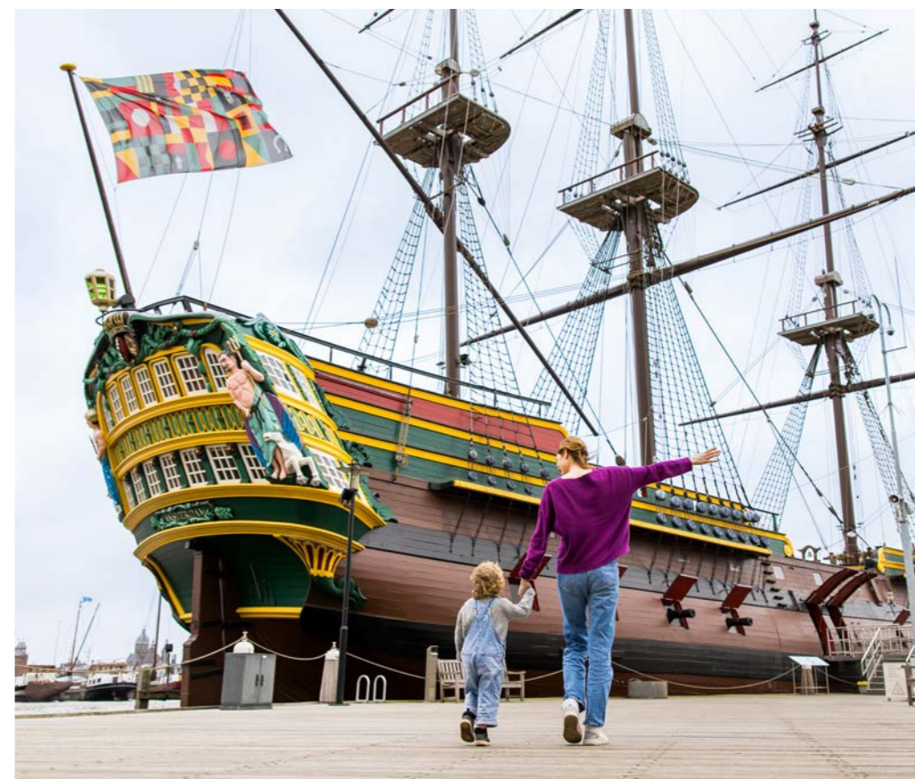
VOC-schip - Twycer

Het tweejaarlijkse International Congress of Maritime Museums (ICMM) vond in 2024 plaats in Nederland en België, waarvan twee dagen in Amsterdam. Deze meerdaagse conferentie in samenwerking met het Zuiderzeemuseum, Maritiem Museum Rotterdam en MAS Antwerpen werd bezocht door 240 deelnemers uit 110 landen.