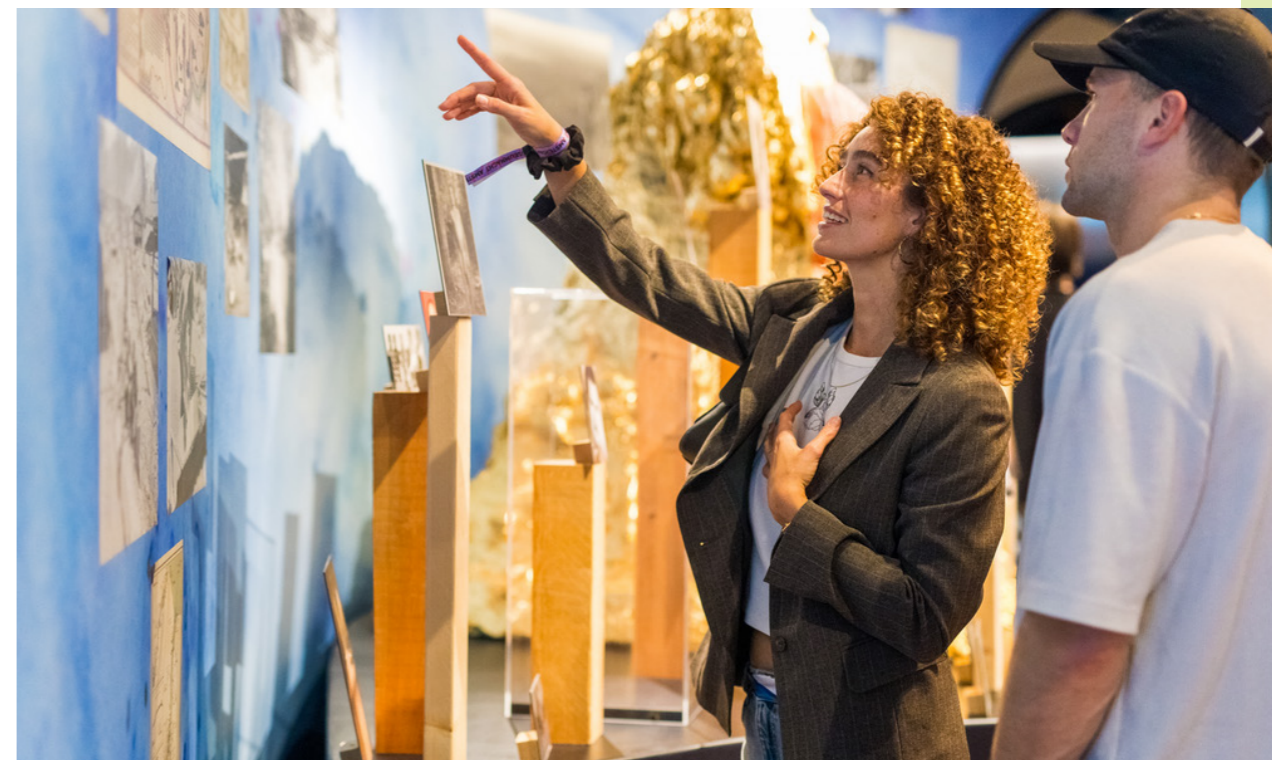
Museumnacht – Twycer

In 2024 werd op een veiling bij Bubb Kuiper in Haarlem een schilderij aangekocht, dat wordt toegeschreven aan Reinier Nooms (ca. 1623-1664). Het schilderij stelt de reis voor van een eskader onder leiding van vice-admiraal Michiel de Ruyter naar de Middellandse Zee in 1661. Nooms was als kunstenaar met dit eskader mee en heeft dit schilderij waarschijnlijk bij terugkomst in Amsterdam gemaakt op basis van zijn schetsen op zee. Het is afkomstig uit de collectie van verzamelaar C.G. 't Hooft (1866-1936). Dankzij een bijdrage van het Mondriaan Fonds en de Vereeniging kon de aankoop van een schilderij van de slag bij Tobago in 1677 door Jan Karel Donatus van Beecq (1638-1722) – ook wel “de Franse Van de Velde” genoemd – succesvol worden afgerond. Verder werden bij veilinghuis De Zwaan in Amsterdam drie schilderijen van de Amsterdamse schilder Clemens Merkelbach van Enkhuizen (1937-2023) gekocht. Alle drie de schilderijen stellen het 's Lands Zeemagazijn voor in de jaren tachtig en tonen het gebouw met verschillende museumschepen aan de steiger. Van de schilder was reeds een ander schilderij met het Zeemagazijn in de collectie aanwezig. De collectie schilderijen werd tot slot aangevuld met de aankoop