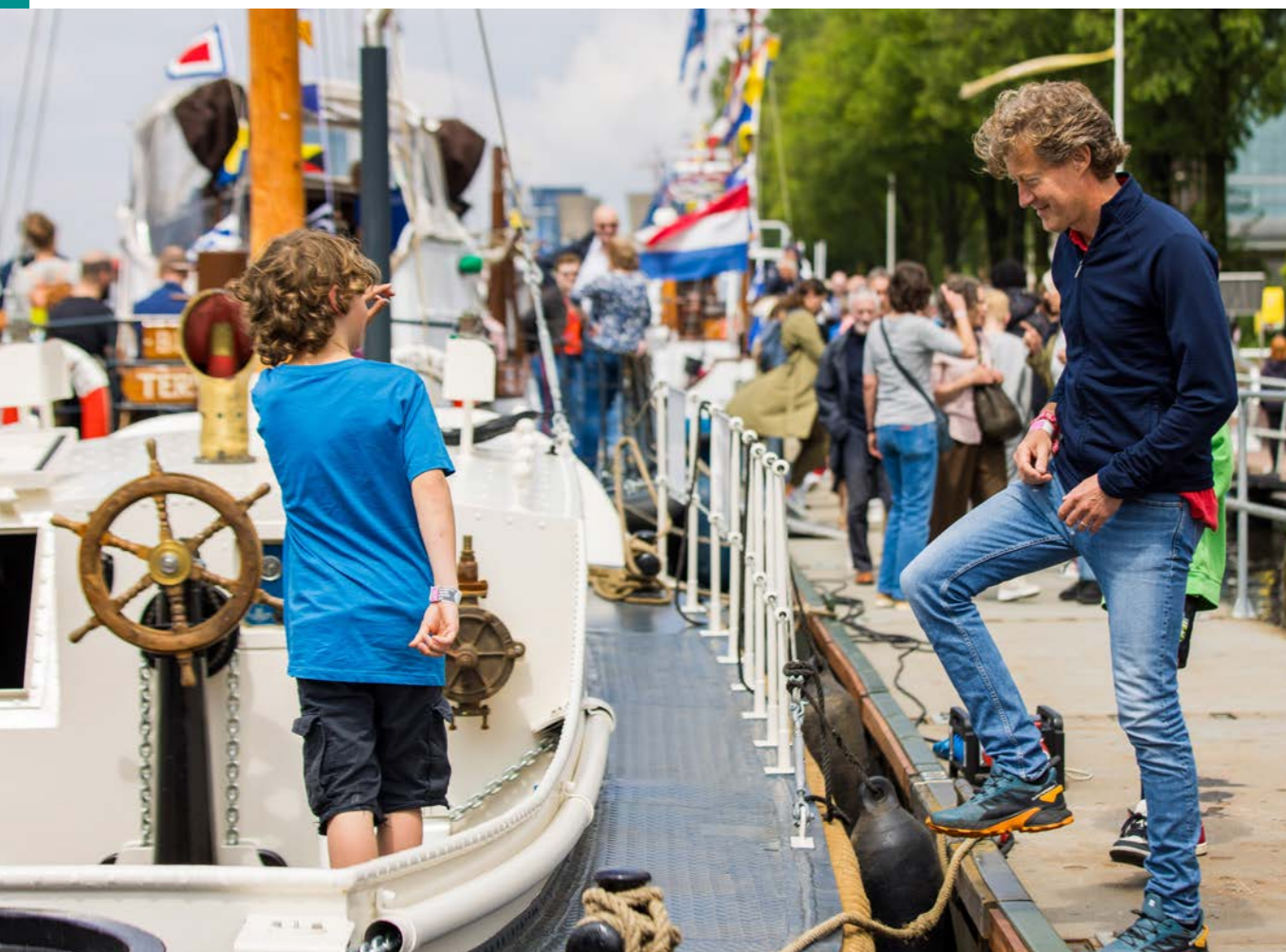
KNRM Reddingbootdag - Twycer