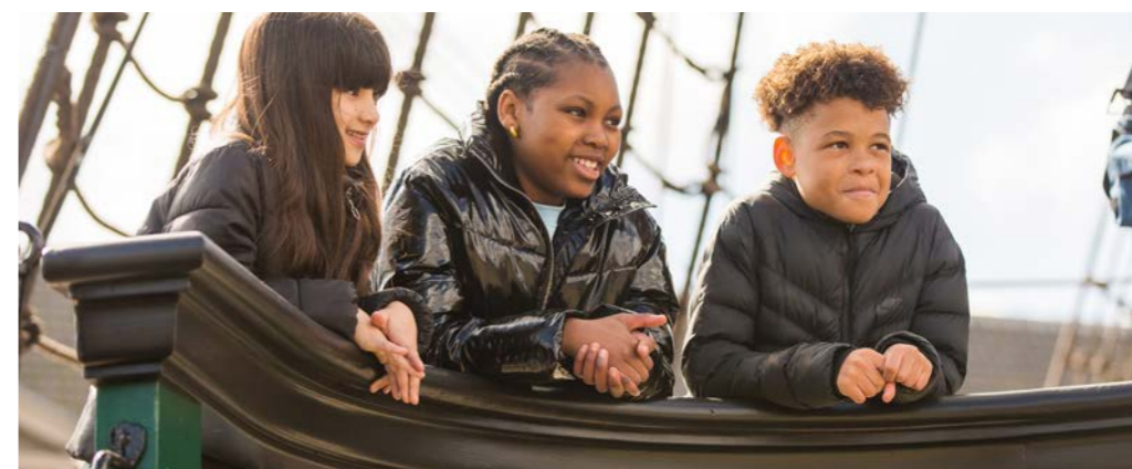
Terugkeer VOC-schip - Twycer

Aangezien koersresultaten niet worden begroot vindt men dit opbrengstpercentage niet direct terug in de begroting.