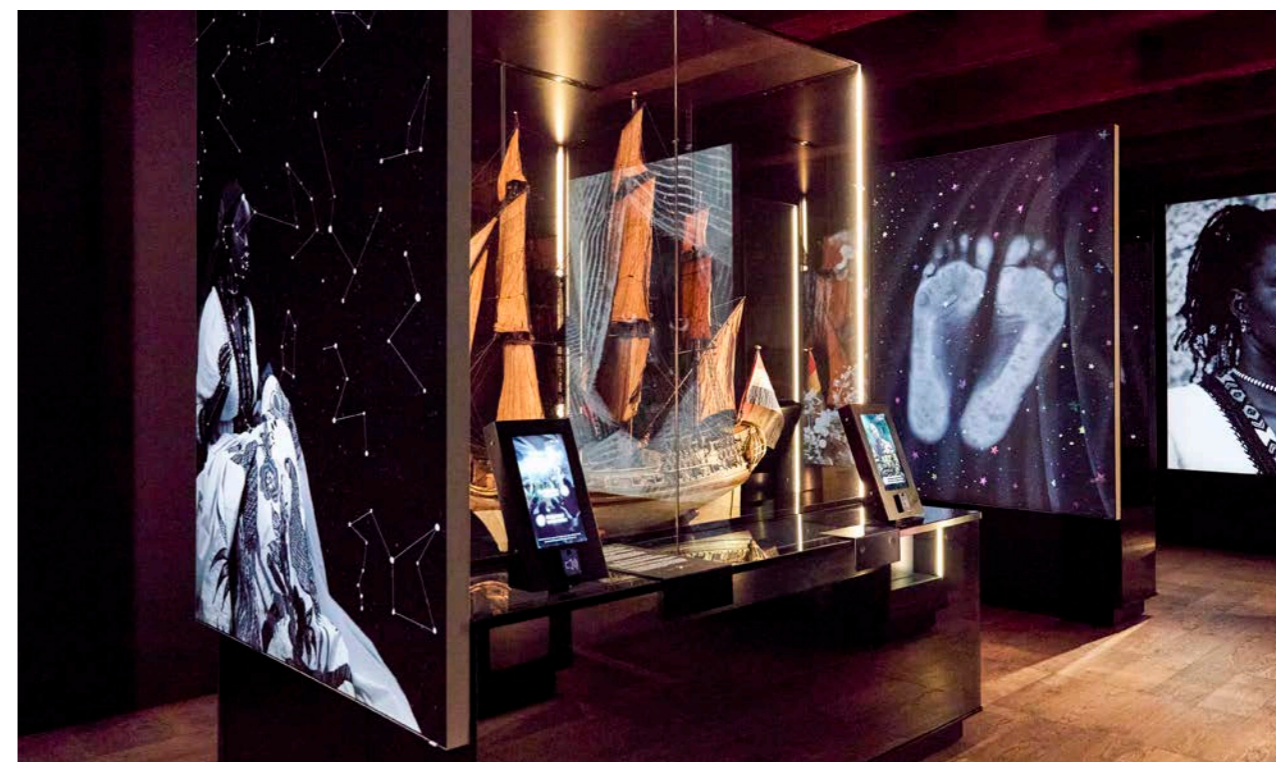
Schaduwen op de Atlantische Oceaan - Roos de Bolster

Om de zichtbaarheid van de collectie te vergroten worden met objecten uit de omvangrijke collectie vaste en wisselende tentoonstellingen gemaakt of tijdelijk uitgeleend aan andere musea. Foto's en beschrijvingen van objecten worden ook digitaal toegankelijk gemaakt voor onderzoek en raadpleging. In 2021 heeft het Museum een ambitieus digitaliseringsproject opgezet om in vier jaar tijd het aantal objecten met een digitale foto van 48% naar 70% te laten toenemen. Aan het einde van 2024 was inmiddels 85% van alle objecten digitaal gefotografeerd. Bijzonder vermeldenswaardig is daarbij de digitalisering van zo'n 70.000 technische tekeningen.