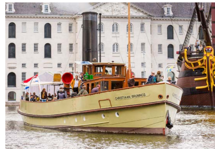
SS Christiaan Brunings - Twycer